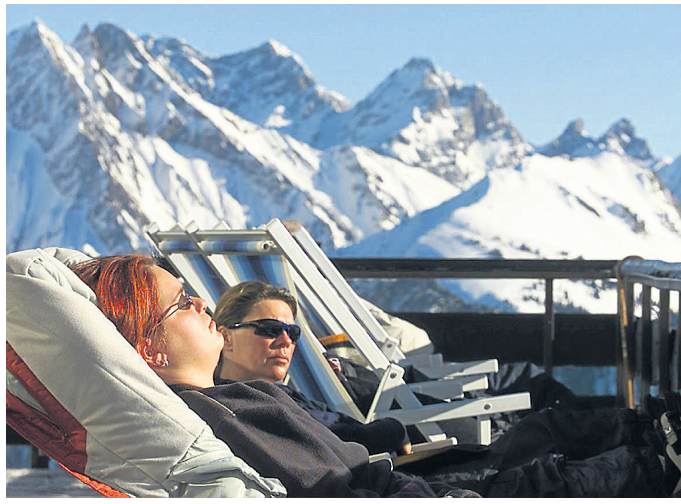
Unbeschwerter Genuss am Fellhorn.